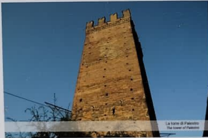
La torre di Palestro The tower of Palestro