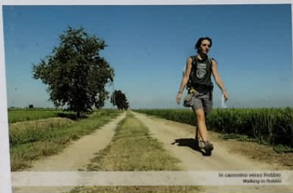
Il cammino verso Robbio Walking to Robbio