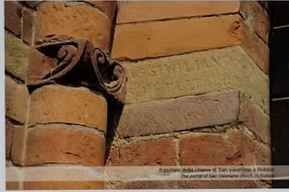
Il portale della chiesa di San Valentino a Robbio The portal of San Valentino church in Robbio