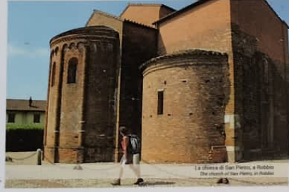
La chiesa di San Pietro, a Robbio The church of San Pietro, in Robbio